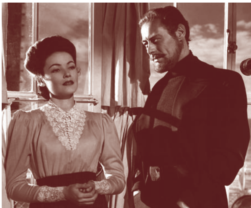
PHOTO L'AVENTURE DE MME MUIR

Même pudeur dans le traitement du passage du temps dans le film Sri lankais, Changement au village . Lester James Peries met en valeur silences et pauses pour évoquer la chute d'une famille aristocratique, et par là, la fin d'une génération.